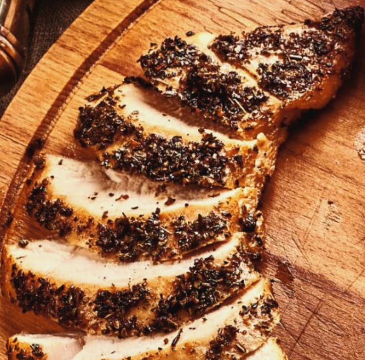
Куриное филе в травах