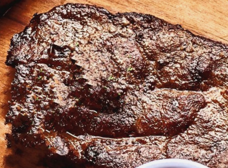
Стейк из свинины