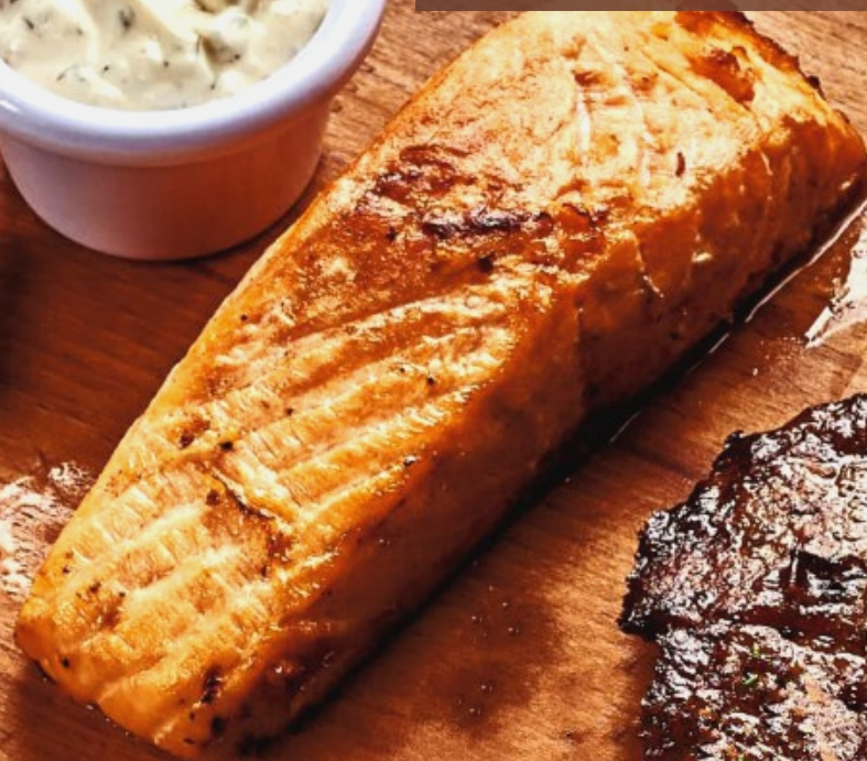
Стейк из семги