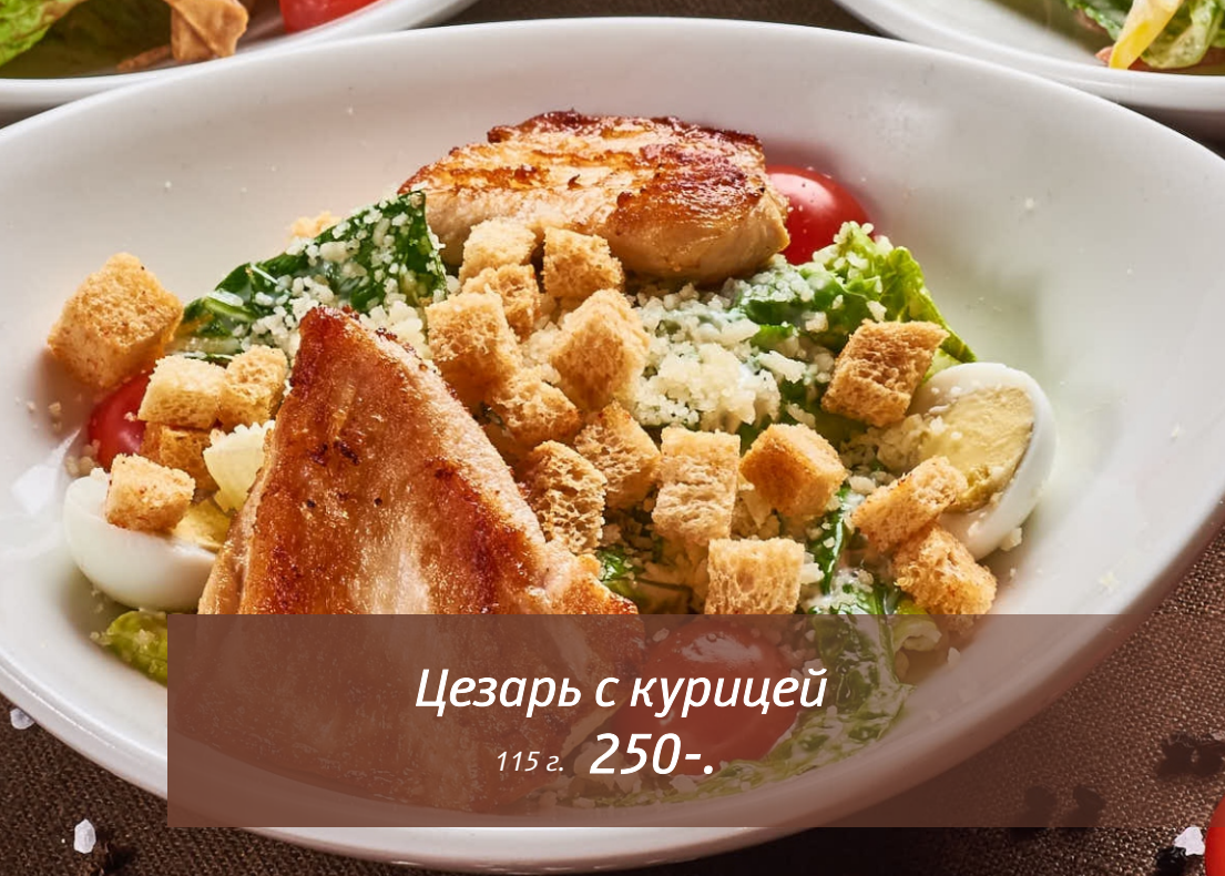
Цезарь с курицей 115 г. 250-.